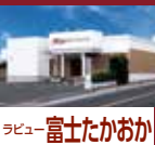
ラビュー 富士たかおか