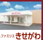
ファミリア きせがわ