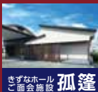
きずなホール 孤蓬