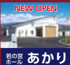
若の宮 ホール あかり