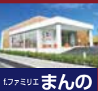
ファミリア まんの