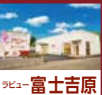
ラビュー 富士吉原