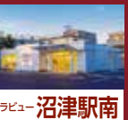
ラビュー 沼津駅南